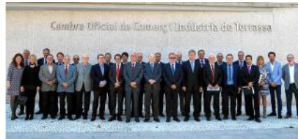
Els comitès executius de les cambres de Manresa, Sabadell i Terrassa, reunits ahir a Terrassa catpress

Aquest és un projecte compatible amb la reclamació del territori de millorar la línia ferroviària entre Manresa i Barcelona (una solució que ha d'aportar Adif), aclareix Casals, per a qui "per a la Generalitat això no suposaria cap despesa, sinó un repensament de les freqüències de pas".