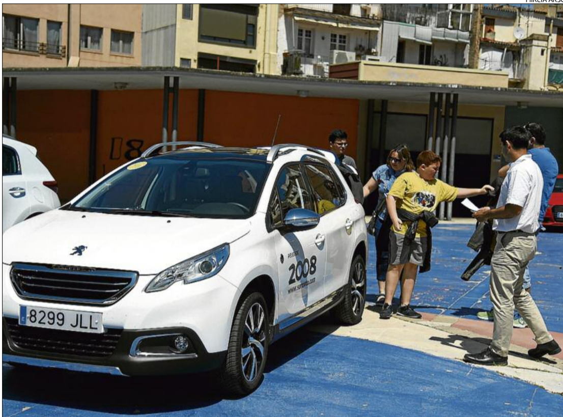
Una família a punt d'entrar en un dels vehicles que hi ha a la plaça Porxada