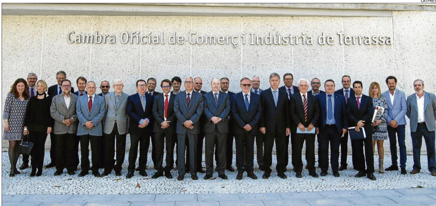
Els comitès executius de les cambres de Manresa, Sabadell i Terrassa, reunits ahir a Terrassa