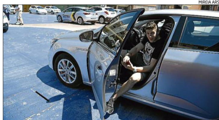
Una imatge després de fer un recorregut amb el vehicle