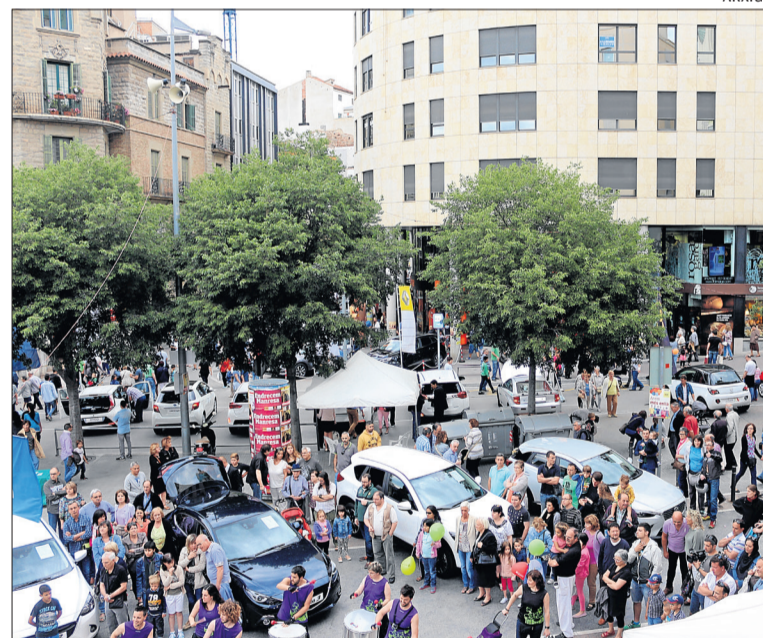
La fira d'aquest any oferirà novetats com el 'Tasca el Bages'

Aquests mercats mensuals se centrarien en el producte de proximitat, i es buscarien paradistes de productes que actualment no són al mercat dels dissabtes, principalment de verdures ecològiques, fruites, llegums, pa, coques, olis, formatges i làctics, embotits... ■