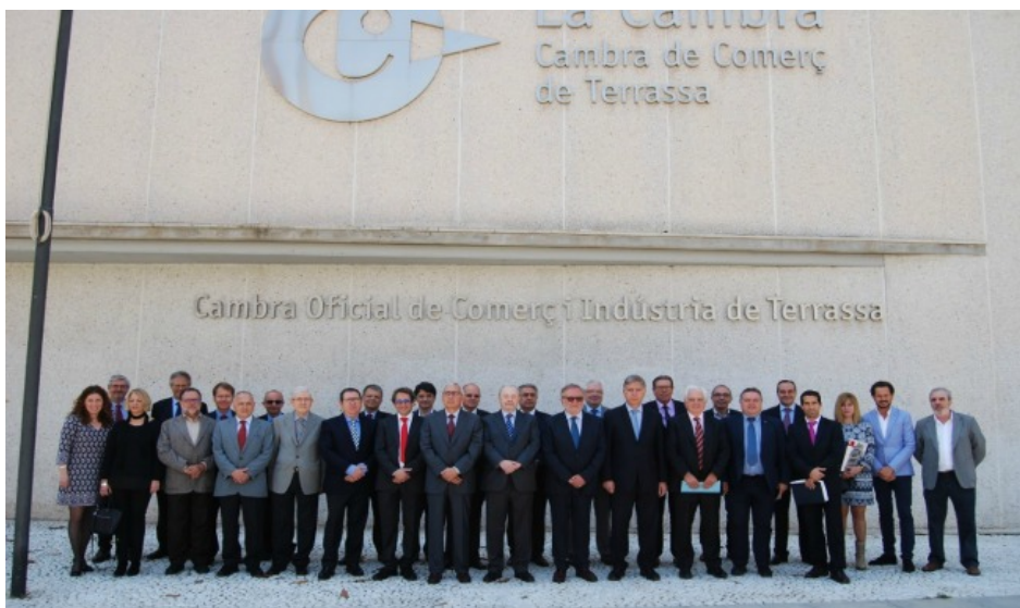
Reunió Cambres Comerç

El Vallès Occidental i el Bages representen el 13,8% del total del PIB de Catalunya i tenen una base empresarial de 76.726 empreses