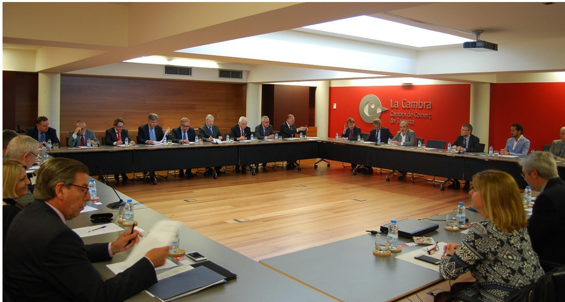
Reunió de les Cambres de Manresa, Terrassa i Sabadell, aquest dimecres a Terrassa

Les Cambres de Comerç de Manresa, Sabadell i Terrassa conclouen que el model de treball territorial, basat en la proximitat, que estan duent a terme en pro de les empreses segueix sent un model vàlid