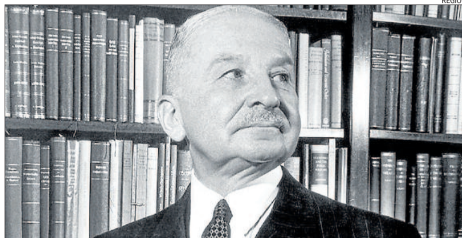
L'economista austríac Ludwig von Mises

de la funció empresarial, elimina la possibilitat de generar el coneixement necessari perquè l'economia funcioni. De fet, a la URSS els preus oficials consistien en l'aplicació de múltiples fórmules que preniën com a base els preus de mercat dels malvats països capitalistes. La seva incapacitat hauria estat més gran i el seu col·lapse més immediat, si el capitalisme no li hagués prestat una de les seves creacions: el coneixement que produeix el mercat a través dels preus lliures. Els soviètics mantenien subscripcions regulars a catàlegs de preus industrials i comercials dels EUA i Europa per tenir alguna referència. Però, al final, els fets són inapel·lables. Atès que el valor d'un bé és subjectiu i que els preus reflecteixen aquesta subjectivitat i l'escassetat del bé, una societat que no disposi de preus lliurement fixats està condemnada al fracàs, al caos i al subdesenvolupament crònic.