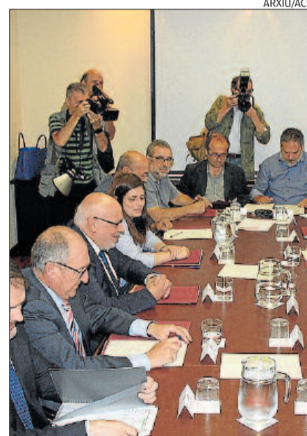
Reunió del Pacte Nacional per la Indústria

Aquests ingredients els tenia, poc o molt encertats, el darrer Pla d'Impuls a la Indústria, una eina que es va presentar públicament fa escassament tres anys i que al cap de poc temps va començar a difuminar-se. Ara ressuscitem la política de clústers, però no és el mateix.