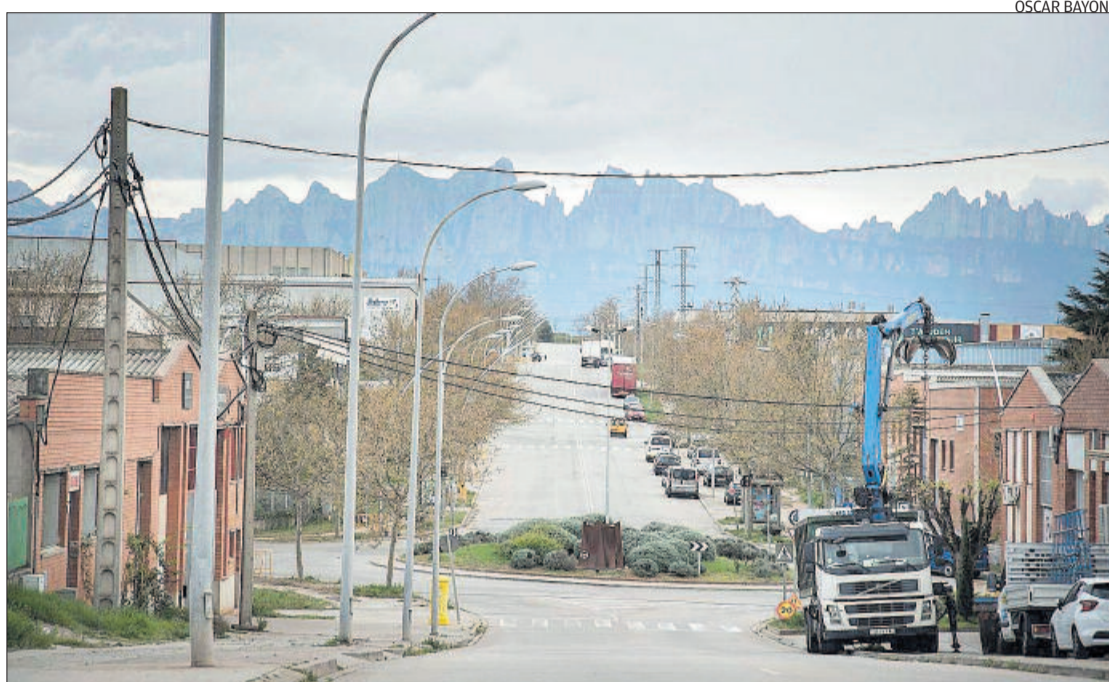
Imatge del polígon manresà de Bufalvent durant l'estat de confinament

La planta de Santpedor de la italiana Magneti Marelli va ser la primera de la qual va transcendir, ja abans del decret de l'estat d'alar-