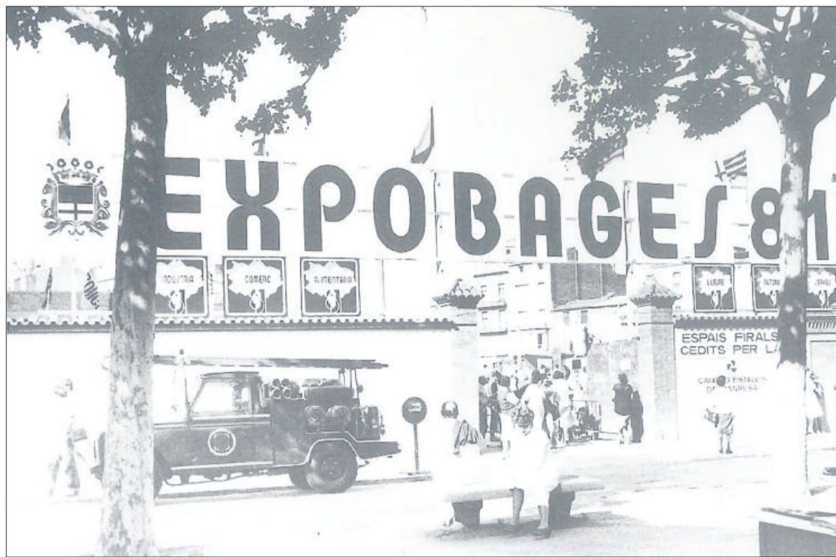
HISTÒRIA GRÀFICA DE MANRESA/MANOLO SÁNCHEZ