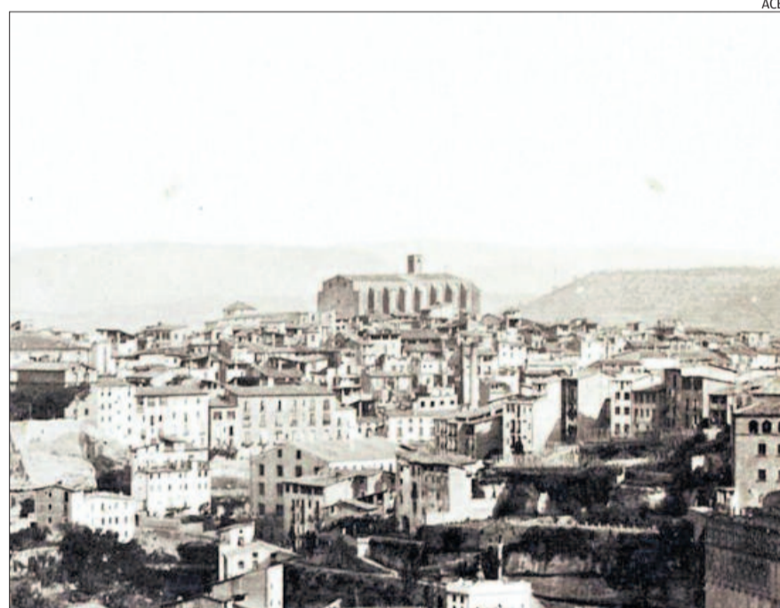
Vista general de la ciutat. Al fons, l'església del Carme

La construcció del temple gòtic es va fer quasi tot en aquell segle. Aquesta circumstància li va donar una unitat d'estil que no