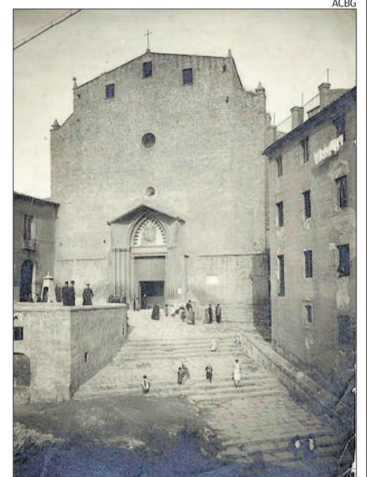
Façana principal de l'església gòtica del Carme

«El convent es va edificar sobre les restes abandonades d'un petit castell i al costat de la torre més alta de Manresa, la de l'Àliga, d'uns 30 metres»